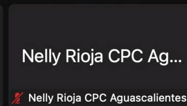
Nelly Rioja CPC Aguascalientes