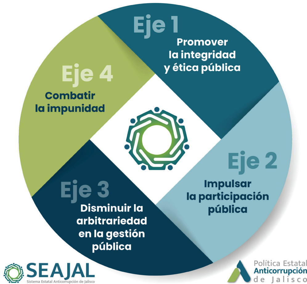
Imagen 1. Ejes rectores en el control de la corrupción