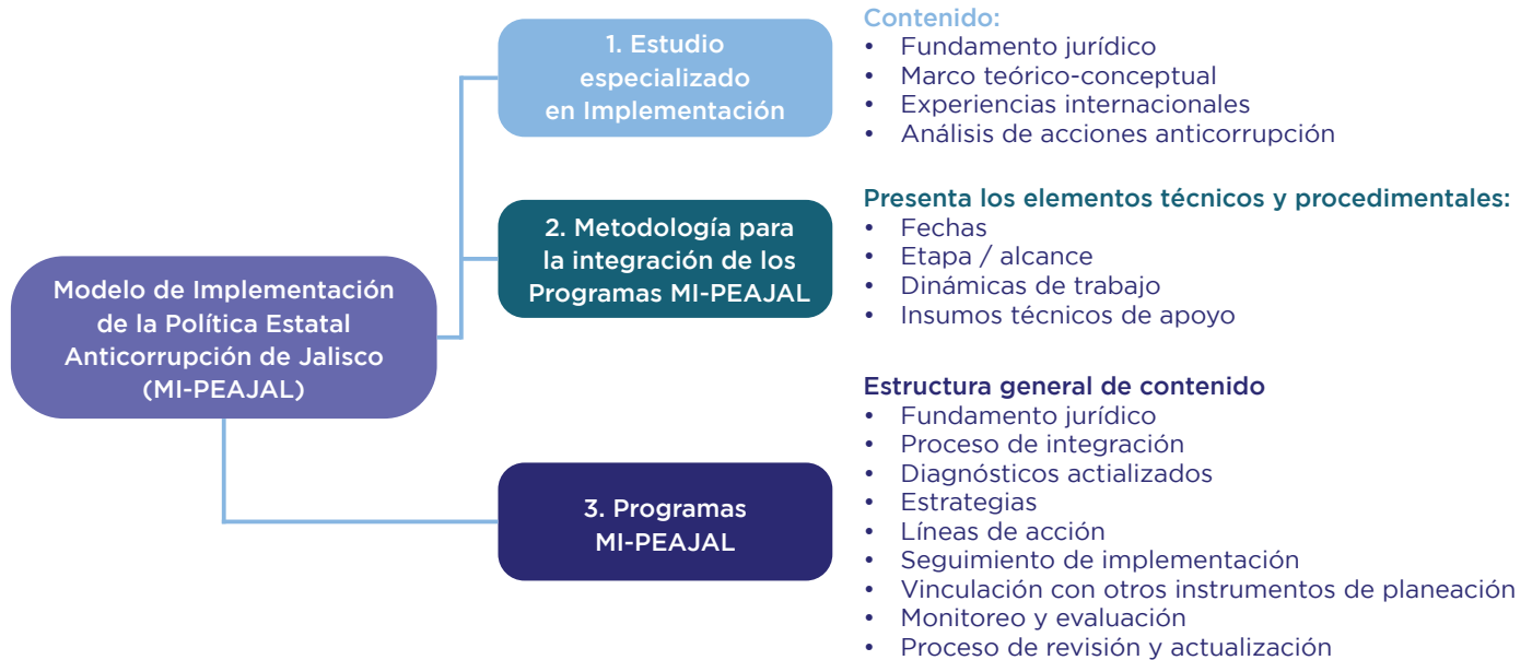
Figura 1. Modelo de Implementación aprobado por el CC

En el actual panorama de implementación anticorrupción de Jalisco, compuesto principalmente por las estrategias y líneas de acción de los Programas MI-PEAJAL 2 , el principal reto es transitar de su diseño a su adopción y operación por parte de todos los entes públicos; sin embargo, tal y como lo marca el Modelo de Implementación 3 , para que este momento se propicie, es importante que todos los entes públicos adopten líneas de acción.